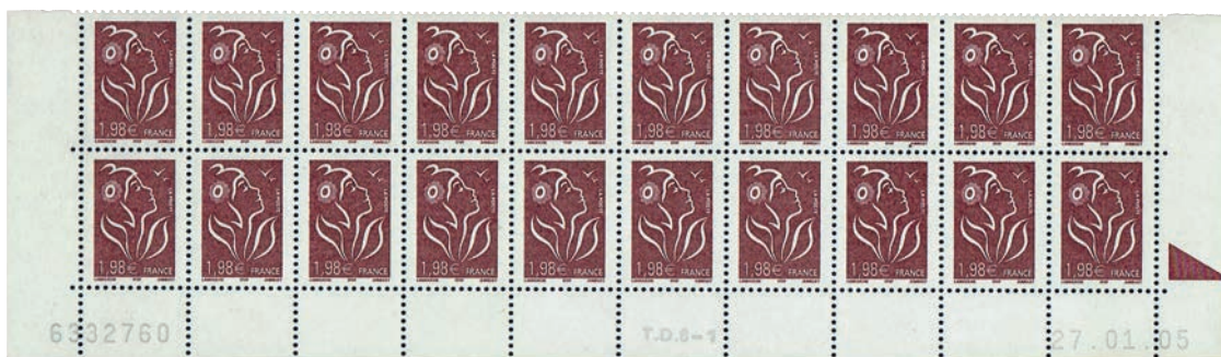
Figure 23 : premier tirage sur la presse TD6-1 imprimé avec deux bandes phosphorescentes Pho E23. (1 er tirage du 1,98 € brun foncé « Marianne des Français - ITVF » du 21.01.05 au 03.02.05).