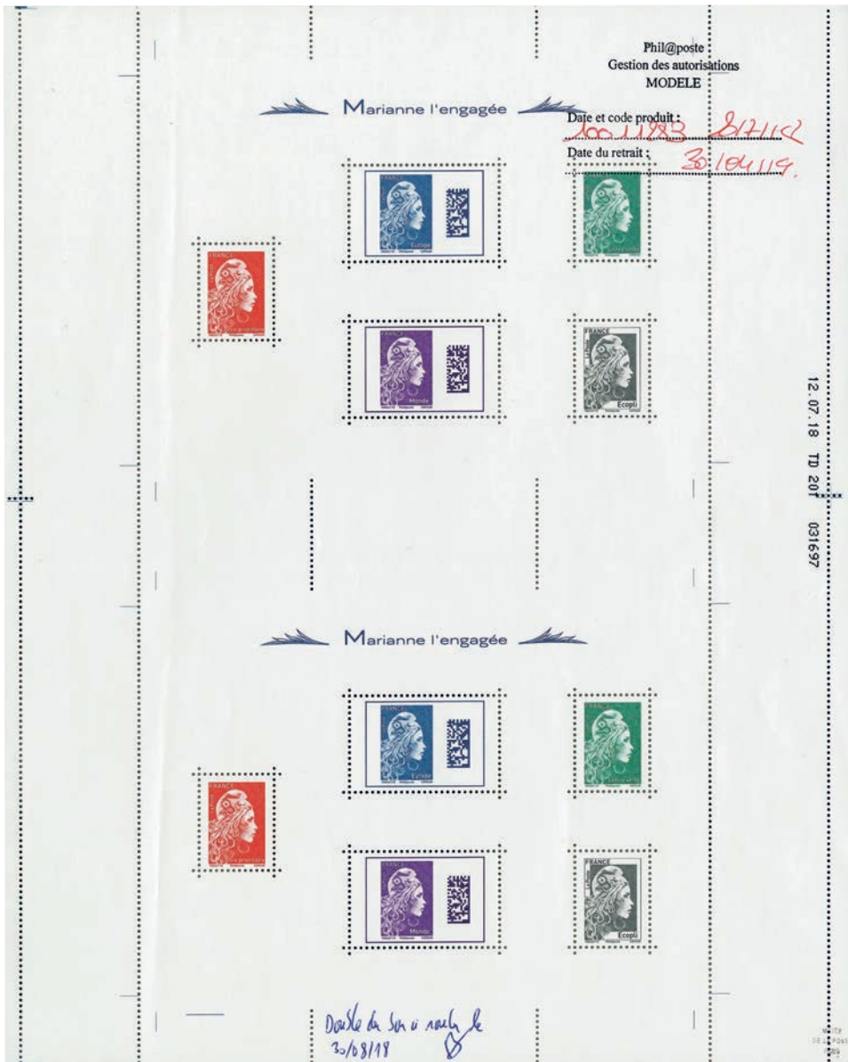
Figure 26 : bon à rouler du 30 août 2018 du bloc-feuillet gommé « Marianne l'Engagée » imprimé sur la presse TD201 le 12 juillet 2018. (source : © Coll. Musée de La Poste, Paris / La Poste, 2021).