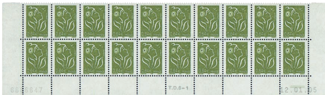
Figure 22 : premier tirage sur la presse TD6-1 imprimé avec une bande phosphorescente Pho E23. (1 er tirage du 0,64 € vert-olive « Marianne des Français - ITVF » du 11.01.05 au 21.01.05).

Les deux tirages occasionnels de janvier 2005 sont exceptionnellement imprimés avec des bandes phosphorescentes Pho E23 . 12 (fig.22 et 23)