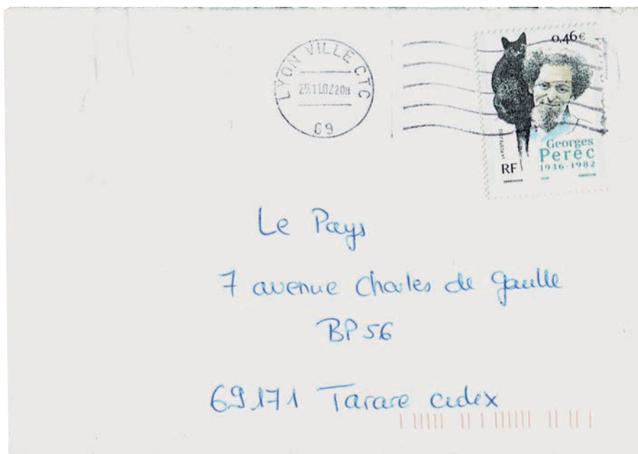
Figure 27 : lettre traitée par une machine Séparatrice-Redresseuse-Oblitératrice NEC de type SRO A11 13 . (empreinte de facture TOSHIBA ou NEC observée depuis le 22 juin 2002).