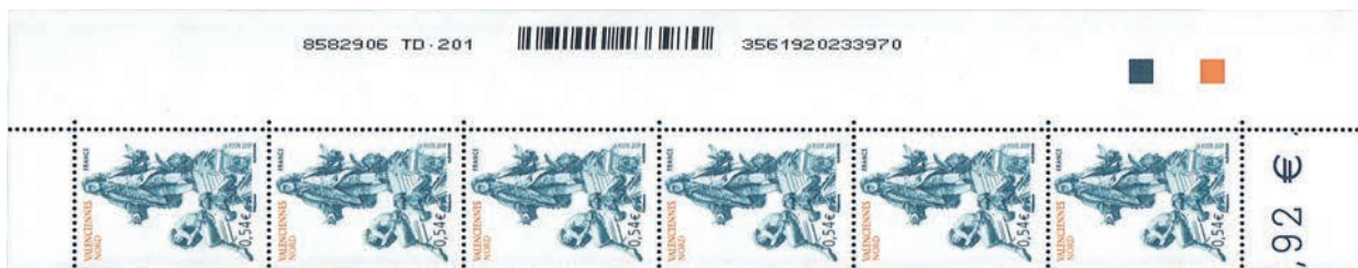
Figure 24 : première émission avec la mention TD201 0,54 € « Valenciennes - Nord » mis en vente le 5 février 2007. Deux bandes phosphorescentes Pho Ecom.

La mention TD201, en remplacement de TD6-1, en marge des feuilles apparaît en 2007 (fig.24).