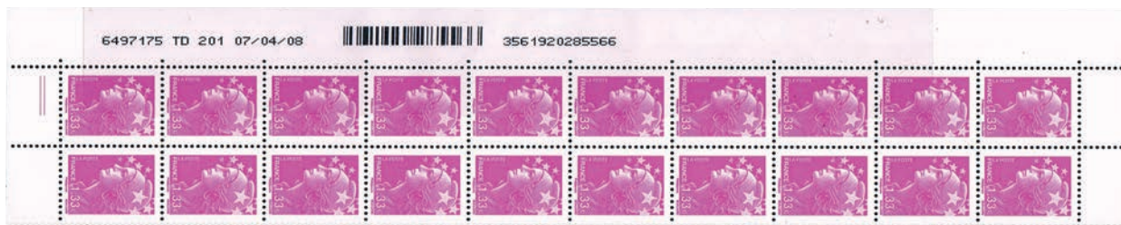
Figure 25 : premier tirage du 1,33 € fuchsia « Marianne et l'Europe » du 04.04.08 au 11.04.08 avec deux bandes phosphorescentes Pho E22.

Trois tirages occasionnels de timbres d'usage courant en 2008 sont de nouveau imprimés avec des bandes phosphorescentes Pho E22 . ( fig.25 et Annexe 4 )