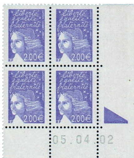
Figure 21 : première journée sur la presse TD6-1 d'un timbre d'usage courant avec deux bandes phosphorescentes Pho E22.

(5 e tirage du 2,00 € violet «Marianne du 14 juillet - RF» du 05.04.02 au 09.04.02).