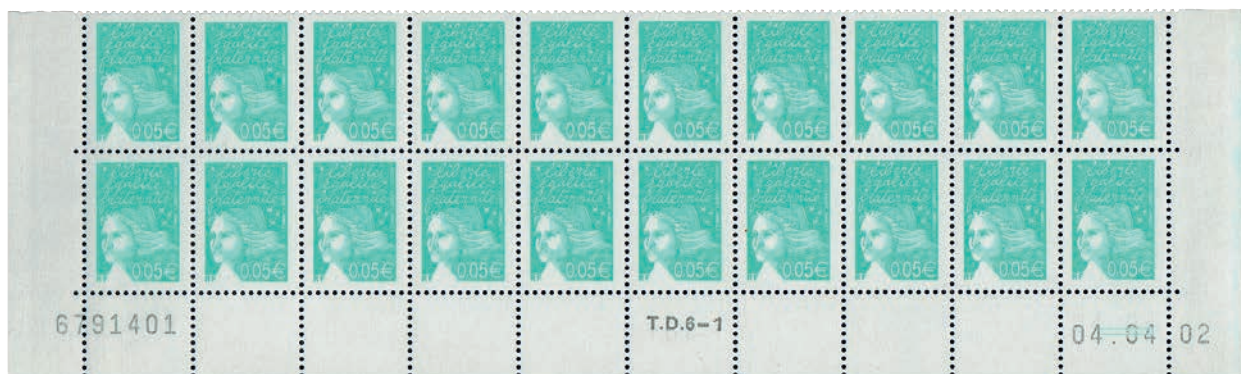
Figure 20 : premier tirage sur la presse TD6-1 d'un timbre d'usage courant avec une bande phosphorescente Pho E22. (4 e tirage du 0,05 € émeraude «Marianne du 14 juillet - RF» du 29.03.02 au 04.04.02).

Les premières impressions avec des bandes phosphorescentes Pho E22 10 sont réalisées en 2002. (fig. 20 et 21)